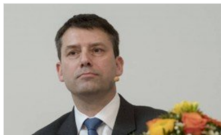
Il presidente delle Chiese Evangeliche Svizzere: «Anche l'omosessualità è volontà di Dio»