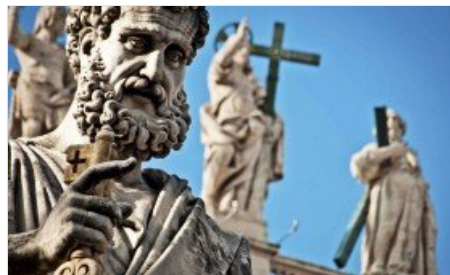
Questa sera si svolgerà una veglia di preghiera social contro l'omotransfobia