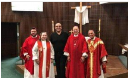
La Chiesa Cristiana Vetro-Cattolica appoggia pubblicamente la legge contro l'omotransfobia