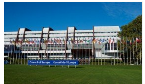
Il Consiglio d'Europa ha rigettato il cosiddetto "accomodamento ragionevole" in materia di religione