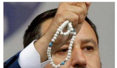
Basta agitare una madonnina o un rosario per potersi dire cristiani? La Bibbia dice di no