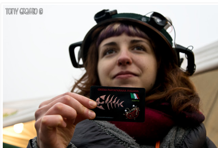
La tessera degli adepti della CPI