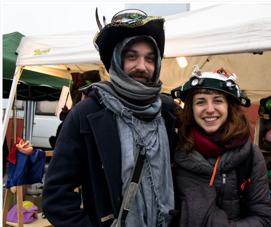
Capitano Pennaliscia della Franciacorta e Sciamagna Saccheggiasaggi Tuttofare Tuffatofu

In un luogo dove mai ti aspetteresti di fare un incontro di questo tipo (davanti ad una bancarella che vendeva cappellini, all'Alterbej), ho conosciuto due adepti di questa religione americana, recentemente arrivata anche da noi a Milano. Gentilmente, questi giovani devoti praticanti, mi hanno concesso una bella intervista per farmi conoscere meglio la loro fede e per pubblicare le loro parole sulle pagine di questo blog.