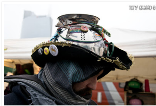
Souvenir raccolti per tutta Italia sono stati aggiunti ad un copricapo ricercato che assomiglia quasi ad un luccicante elmo spagnolo del 1400

CPF: Di fatto noi siamo pastafariani, non per la dieta che non c'entra nulla, ma perché il nostro Dio è il Prodigioso Spaghetti Volante che ha creato il mondo dopo una grandissima sbornia, anzi, scusa, durante una grandissima bevuta alcoolica ed è a causa di questo fatto che il mondo è imperfetto. Poi, Lui si è dimenticato di noi e non si ricorda d'averci creato, però circa 5-6000 anni fa Lui ha toccato questo pezzo di terra dell'Universo e da lì siamo nati noi... Ed è così.