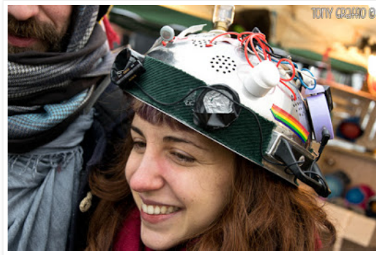
Pastafarian-pride (la lampadina del frigorifero ben s'intona allo stile da cucina di questo classico scolapasta italiano d'alluminio)

TG: Capitan Pennaliscia, come minestro di culto, puoi chiarirmi se avete un dio supremo, qualcuno che venerate?